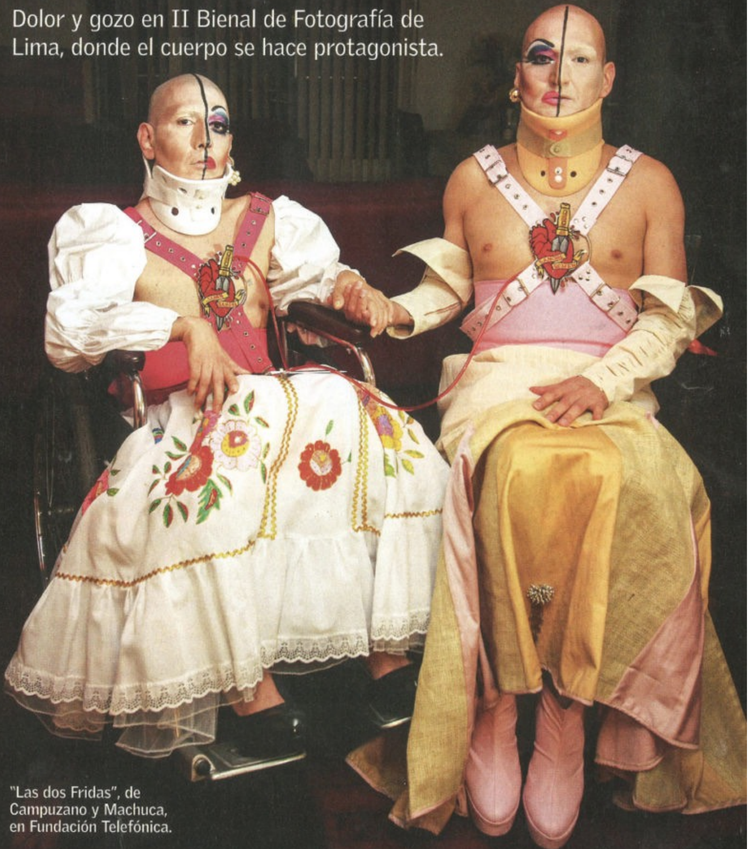
"Las dos Fridas", de Campuzano y Machuca, en Fundación Telefónica.

Dolor y gozo en II Bienal de Fotografía de Lima, donde el cuerpo se hace protagonista.