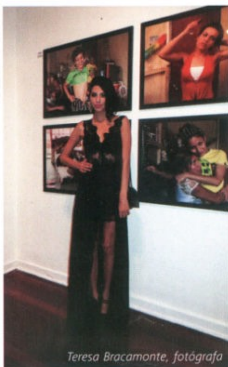
Teresa Bracamonte, fotógrafa

La exposición comenzó el jueves 29 de mayo y podrá ser vista hasta el 4 de julio, de martes a domingo, de 12:00 m. a 10:00 p.m. en el Centro Cultural de España, Natalio Sánchez 181, Santa Beatriz, Lima. Ingreso libre.