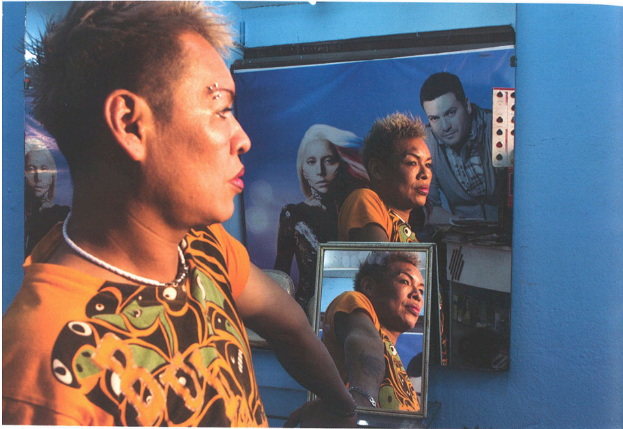
Serie Peluquerías , 2013.